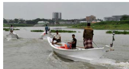
Ci-dessus: les bateaux de pêche «masdoris», construits par l'ONG Friendship en fibre de verre, remplacent avantageusement les embarcations traditionnelles en bois, d'une durée de vie très limitée. Leur forme n'est pas sans rappeler celle de Tara Tari .

* L'Aventure de «Tara Tari» , éd. La Découverte. Ce livre a obtenu le prix Bernard-Moïtessier et le prix Avenir de l'Institut français de la mer. Pour plus d'informations: < http://tara-tari.blogspot.com > et < http://www.watever.org >.