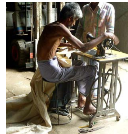
Ci-dessus : préparation de la toile de jute (détail en haut à droite). Ci-contre : fabrication de cuves. Ci-dessous : la toile de jute a été longuement préparée avant d'être appliquée sur la coque pour être stratifiée. Le pont (photo du bas) a été réalisé sur un moule en contreplaqué fin, courbé et ciré.